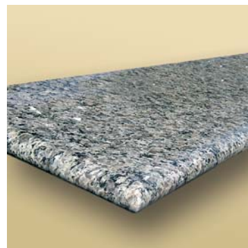
Wykończenie z półwałkiem.