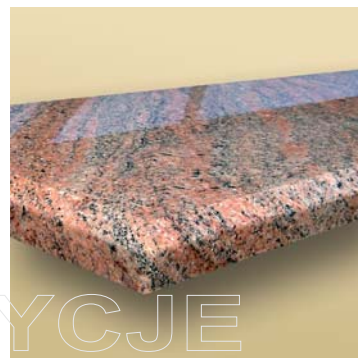
Wykończenie z fazą.